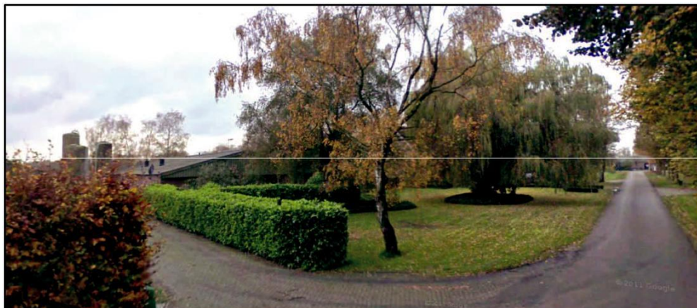
Figuur 38. Huidige landschappelijke inpassing aan de voorzijde van het perceel aan de Driehoekstraat 8.