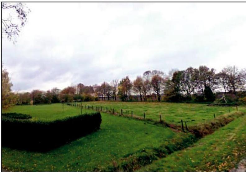
Figuur 36. Huidige situatie Driehoekstraat 8.

De planlocatie aan de Driehoekstraat 8 is gelegen in het kampenlandschap van Someren. Een kampenlandschap is van oorsprong een kleinschalig en besloten landschap. De planlocatie aan de Driehoekstraat 8 is thans in gebruik ten behoeve van de intensieve veehouderij binnen gebouwen en op verharding, met een bedrijfswoning hierbij. De bedrijfswoning is landschappelijk goed ingepast. Het overige gedeelte van de planlocatie kent in het huidig gebruik geen hoge landschappelijke waarde. Het westelijke deel van het plangebied is in gebruik als grasland en de planlocatie is aan de westkant door een bomenrij begrensd. Navolgende figuur geeft een beeld van de huidige situatie aan de Driehoekstraat, op het gedeelte van de planlocatie waarop de nieuwe woningen worden gebouwd.