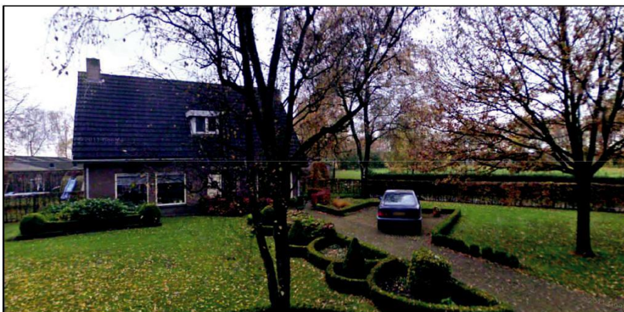
Figuur 37. Huidige landschappelijke inpassing van de bedrijfswoning aan de Driehoekstraat 8.

De bedrijfsbebouwing en de bedrijfswoning zijn reeds landschappelijk ingepast middels (voornamelijk) streekeigen beplanting. De bedrijfswoning is ingepast door het gebruik van lage- en middelhoge hagen en enkele solitaire bomen. Aan de voorzijde van de woning is een grasveld aanwezig. Navolgende figuren geven een beeld van de huidige en te behouden landschappelijke inpassing van de woning aan de Driehoekstraat 8.