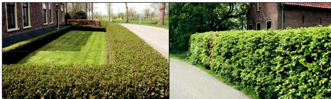
Figuur 39. Voorbeelden passende erfafscheidingen voor de woningen.

De lage haag aan de voorzijde van de woningbouwpercelen gaan in de achtertuin over naar een vrij groeiende haag, heg, houtwal of boomsingel. Hiervoor kunnen bijvoorbeeld eiken, berken, beuken, zoete kersenbomen en struiken zoals (knot)wilgen, elzen of eiken gebruik worden. Navolgende figuur geeft voorbeelden van erfbeplantingen die passend zijn voor de woningen op de planlocatie aan de Driehoekstraat 8.