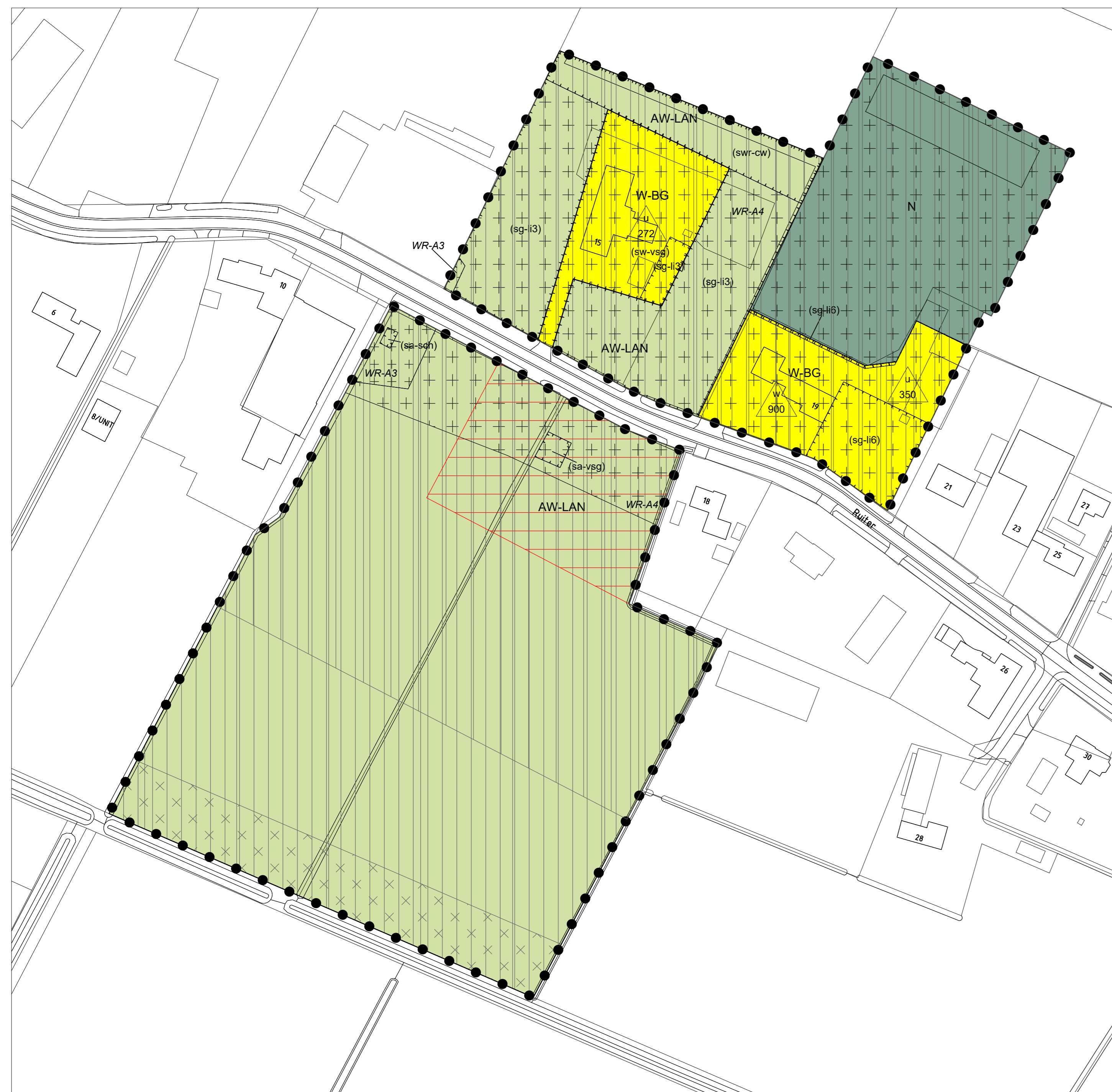
Ruiter 15, ongenummerd en Ruiter 19