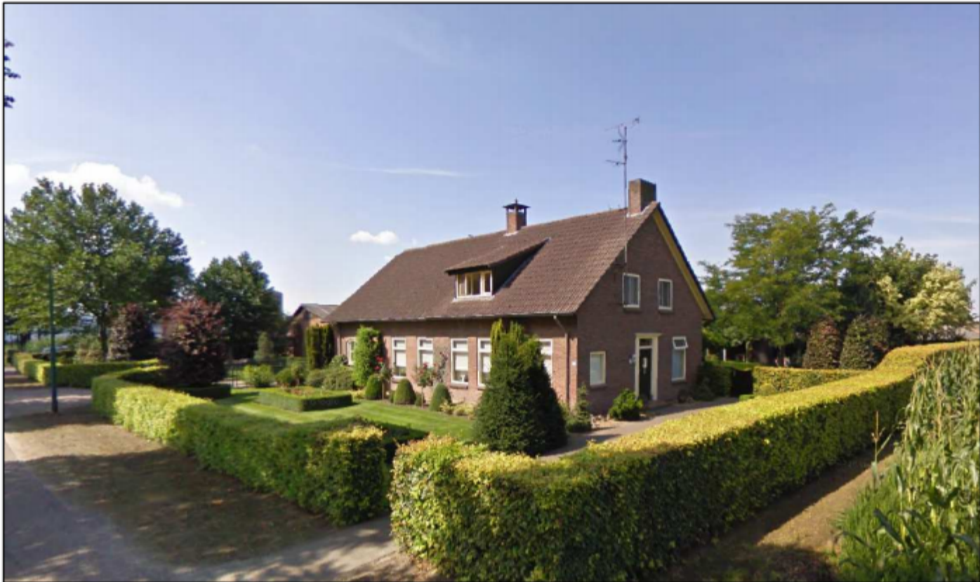
Figuur 10: Landschappelijke inpassing projectlocatie

Initiatiefnemer is thans niet meer in bezit van het agrarisch bedrijf met bijbehorende gronden en opstallen. De beoogde plattelandswoning, in bezit van initiatiefnemer, is thans landschappelijk goed ingepast door middel van onder andere lage en middelhoge beukenhagen, seringen en platanen. Deze landschappelijke inpassing zal na de beoogde herontwikkeling behouden blijven en duurzaam worden onderhouden. In navolgende figuur is een foto weergegeven van de beoogde plattelandswoning, waarbij de landschappelijke inpassing is weergegeven.