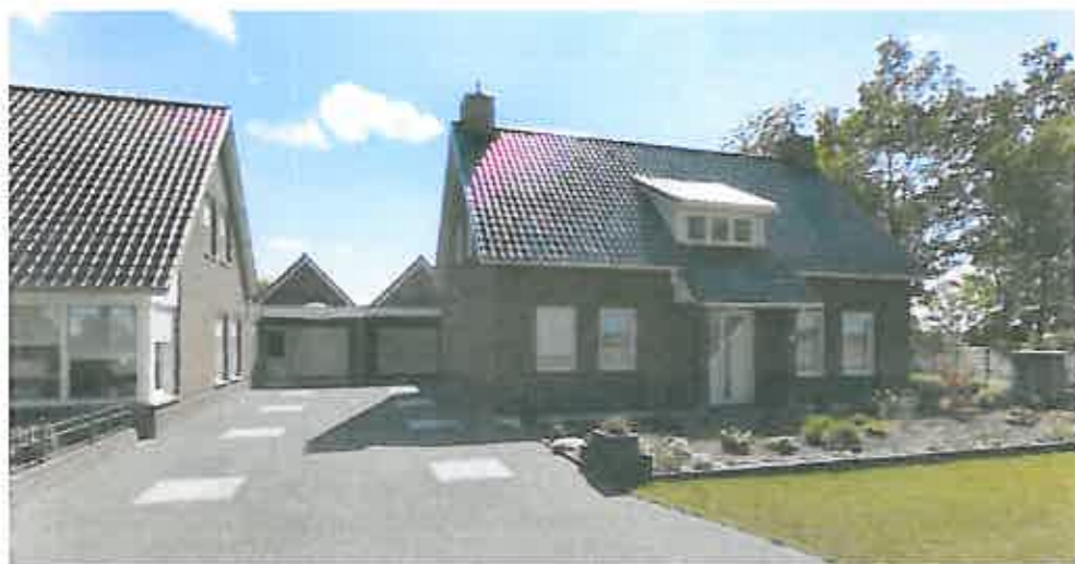
Straataanzicht Smulderslaan 11-13, Someren-Heide