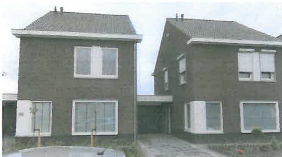
Straataanzicht geschakelde woningen Zilveren Maan Someren (voorbeeld gewenste situatie gespiegeld)