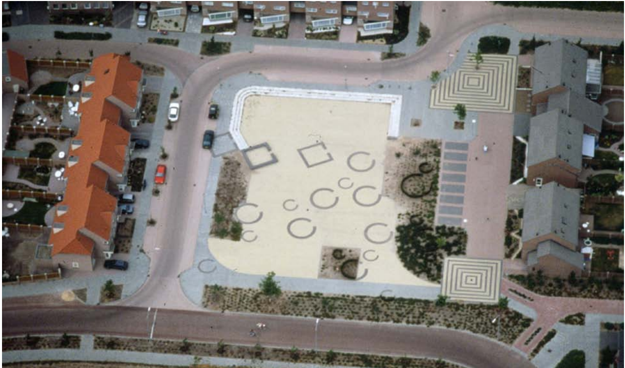
Figuur 3. Someren, woonwijk Waterdael: kringgreppels van een urnenveld uit de IJzertijd, aangegeven in de bestrating en de begroeiing van een plein aan de Amer.

Archeologische resten die bij opgravingen blootgelegd worden kunnen vervolgens - samen met het historisch verhaal dat daarmee verbonden is - een belangrijke toegevoegde waarde vormen voor de ruimtelijke kwaliteit en de ontwikkeling van onze gemeente. Op locaties die zich daartoe lenen is het aan te bevelen aan die voorgeschiedenis op gepaste wijze aandacht te schenken. Ook hierin wil de gemeente, behalve een stimulerende rol richting ontwikkelaars, zelf een concrete bijdrage leveren, bijvoorbeeld via de inrichting van de openbare ruimte.