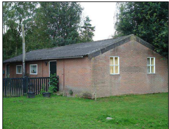
Figuur 4: Aangebouwde loods en vrijstaand bijgebouw in oorspronkelijke stijl