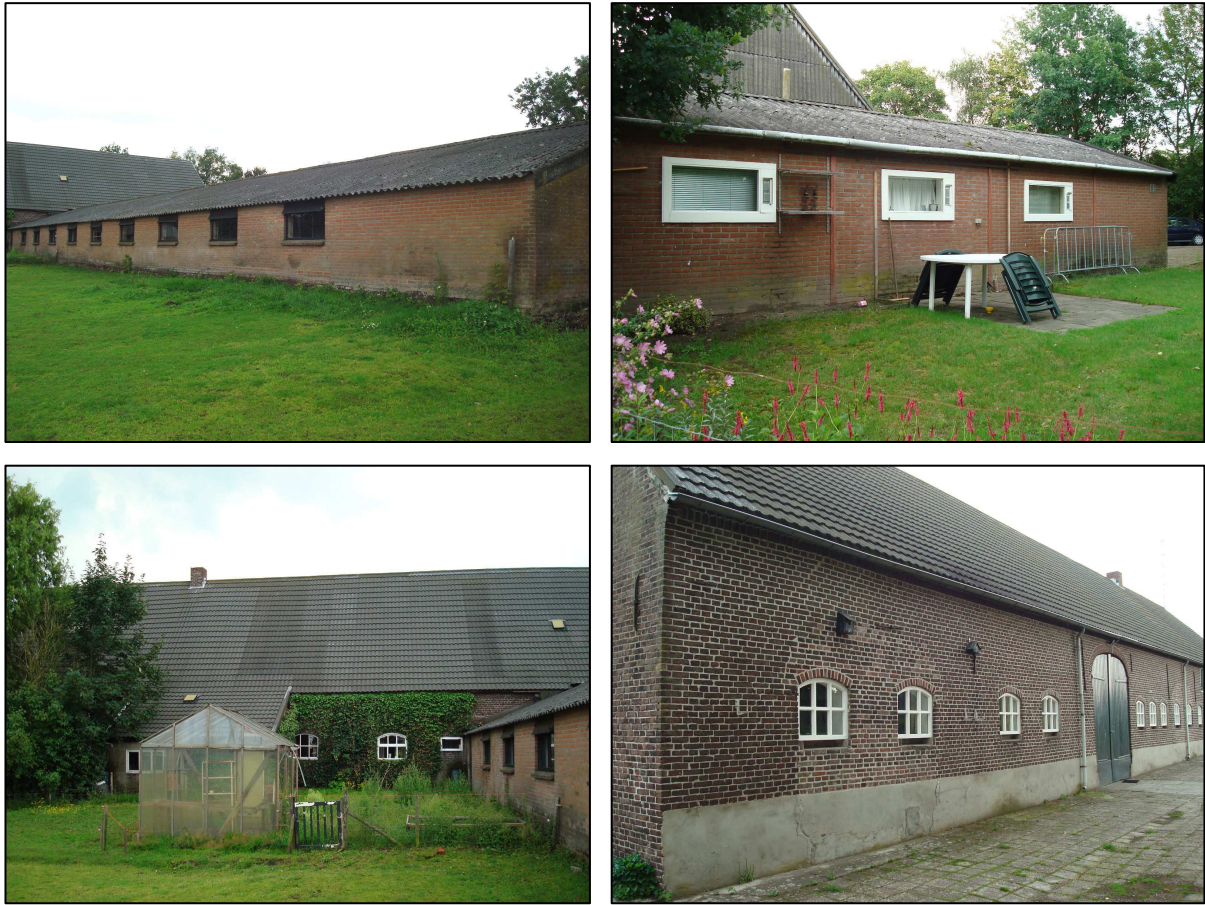
Figuur 2: Uitstraling bebouwing huidige situatie (met de klok mee: loods, vrijstaand bijgebouw, voorzijde woonboerderij, achterzijde woonboerderij)

Navolgend figuur geeft een beeld van de huidige uitstraling van de te behouden bebouwing.