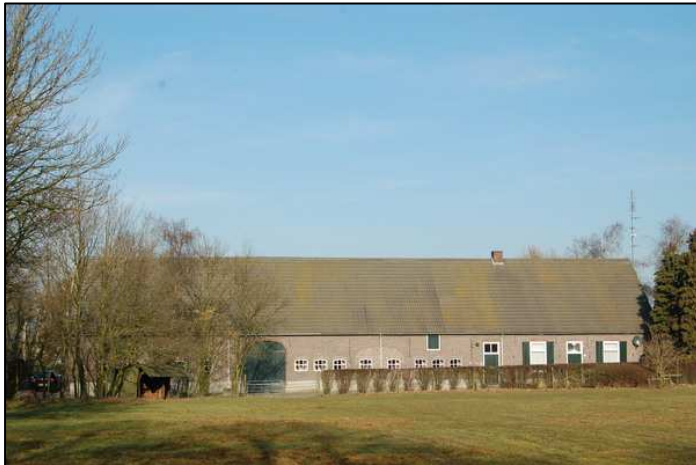
Figuur 6: Langgevelboerderij aan Moorsel 3

Middels de beoogde herontwikkeling wordt de resterende bebouwing bestaande uit de langgevelboerderij, de daarachter gelegen loods en een vrijstaand bijgebouw opgewaardeerd ter verbetering van de cultuurhistorische waarden van de locatie Moorsel 3. De huidige uitstraling van de bebouwing doet geen recht aan de cultuurhistorische waarde van de locatie.