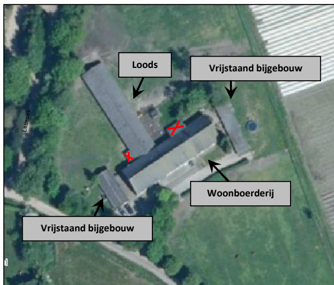
Figuur 1: Te behouden en te saneren bebouwing op plangebied Moorsel 3 te Lierop

Navolgend figuur geeft een overzicht van de bestaande bebouwing. De te slopen bebouwing is met rode kruisen weergegeven.