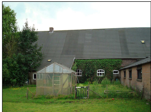
Figuur 3: Nieuwe achtergevel (links) voormalige situatie (rechts)

De aangebouwde loods en het vrijstaande bijgebouw zullen in eenzelfde stijl opgewarderd worden. Navolgend figuur geeft de huidige uitstraling van de bijgebouwen weer. Deze gebouwen zullen worden voorzien van gepotdekselde gevels.