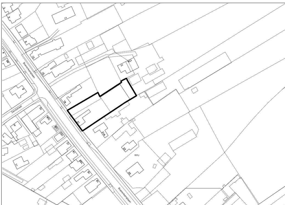
Begrenzing plangebied luchtfoto (Google Maps) en kadaster