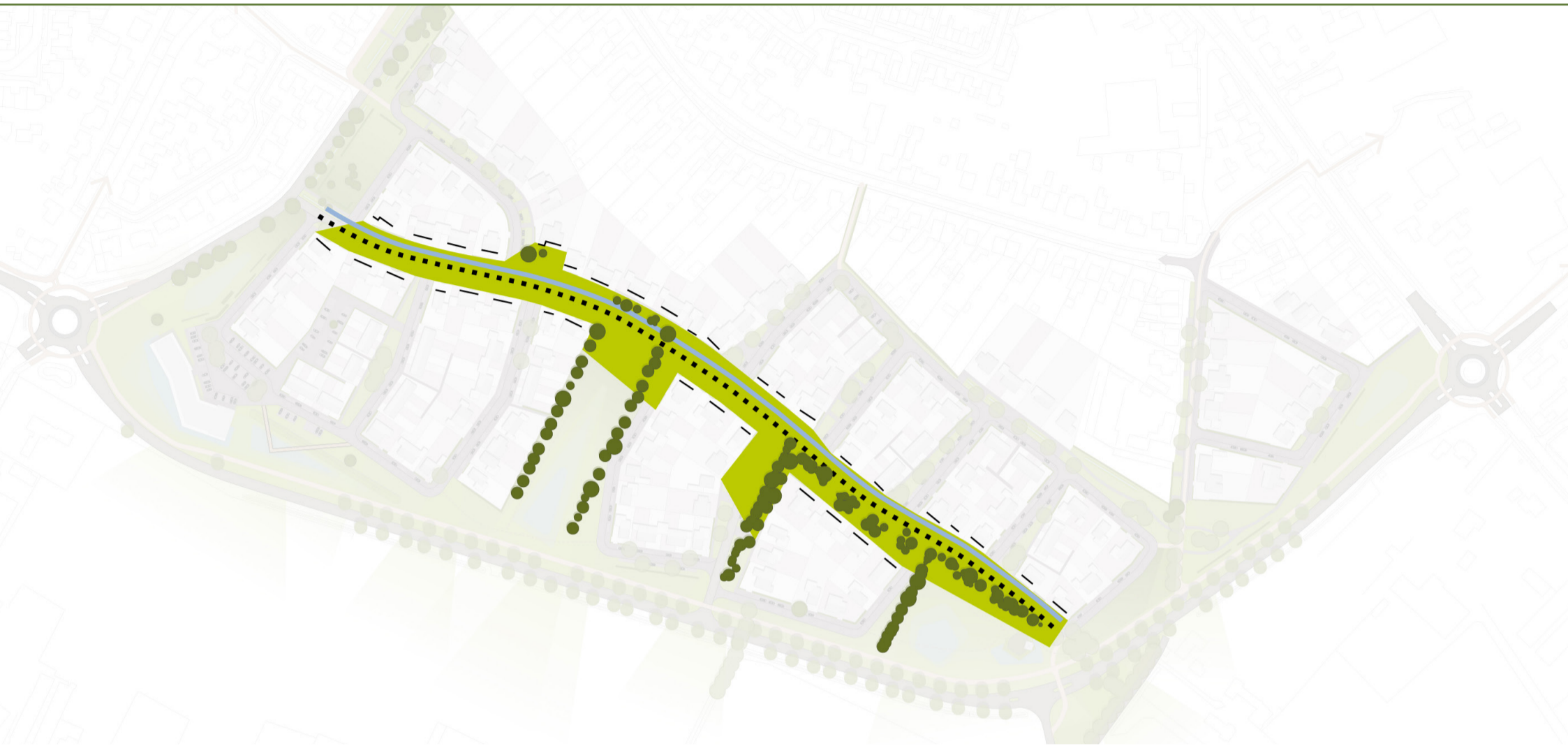
Brede groenstrook met ruimte voor parkeren