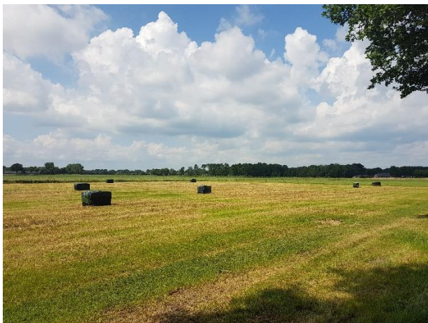
Grasland (loopt zonder duidelijke erfgrens over in het omliggende landschap)