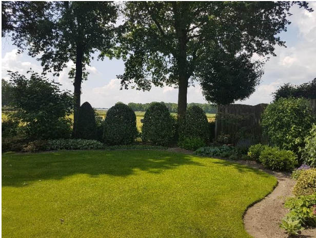
Achtertuin (aangelegd als siertuin)

Tussen het grasland en de siertuin (achtertuin) en tussen de paardenwei en de achtertuin is een houtwal aangebracht tussen een rij van zes volwassen eiken ( Quercus robur ). Deze houtwal bestaat uit diverse inheemse soorten zoals; Amelanchier lamarckii , Ilex aquifolium , Corylus avellana , Sambucus nigra en Acer campestre . Deze houtwal loop 'naadloos' over in de borders van de achtertuin.