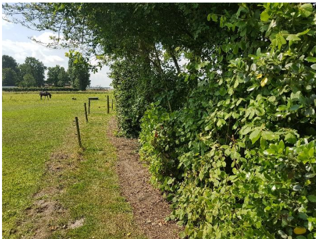
Houtsingel (scheiding tussen siertuin en grasland met inheemse soorten en volwassen eiken)