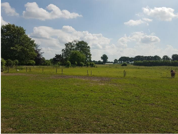
Paardenwei (loopt zonder duidelijke erfgrens over in het omliggende landschap)