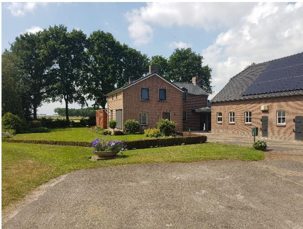
Gebouwen (met voortuin omsloten door Buxus- en Berberishagen)

woonhuis met loods – noordzijde van het perceel (te bereiken via verharding aan de zijde van de Ruiters) en het bijgebouw – oostzijde (te bereiken via een gras pad via de oprit).