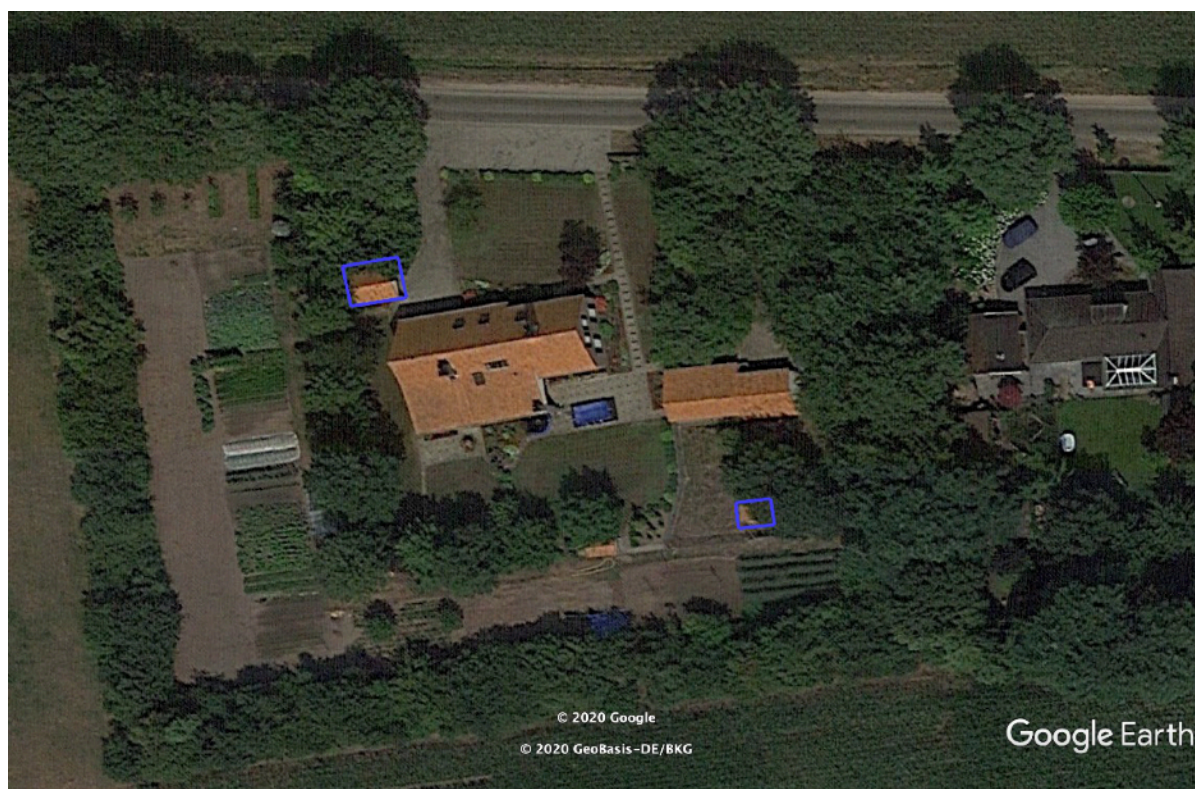
Afbeelding 1: ligging plangebied met te slopen structuren in blauw

Men is voornemens de twee kleinere gebouwen te slopen en een nieuwe schuur te herbouwen. Opstaande groenstructuren of waterstructuren worden daarbij niet aangetast.